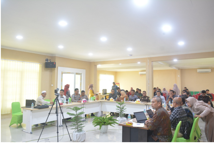
Fakultas Hukum Universitas Malikussaleh Kembali Gelar Workshop Tentang MBKM