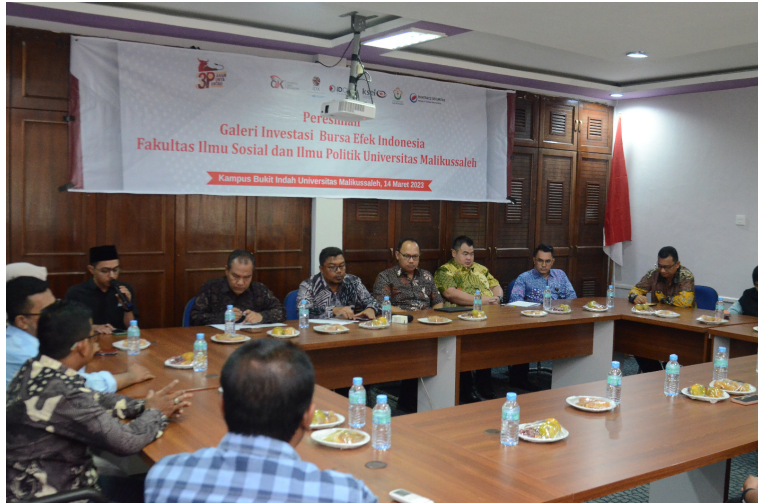
Fisipol Unimal Resmikan Galeri Investasi Bursa Efek Indonesia