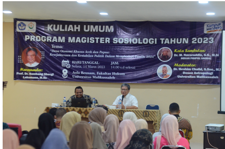
Program Magister Sosiologi Unimal Adakan Kuliah Umum Bahas Tantangan Pembangunan Inklusi.