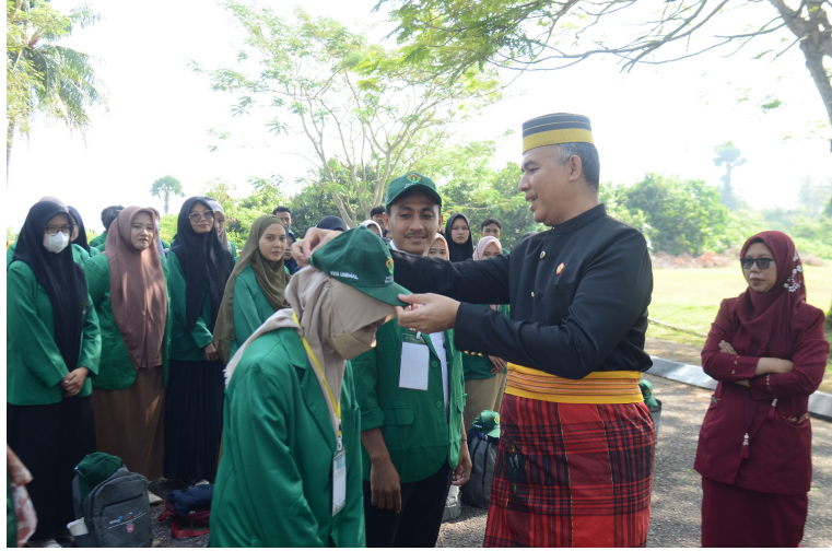
Ini Pesan Rektor Unimal Saat Melepas Mahasiswa KKN Tematik.