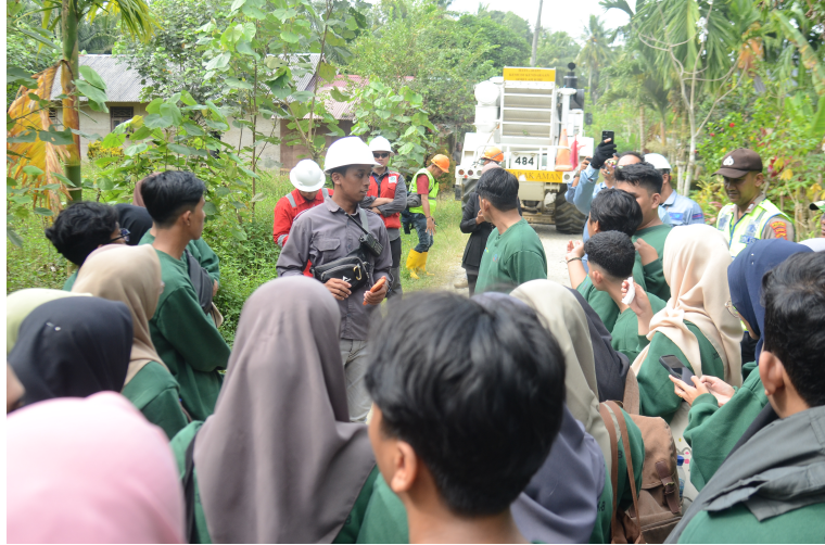
Mahasiswa Unimal Melihat Langsung Proses Seismik yang Dilakukan PT GSI.