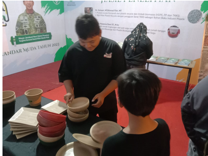
Pengunjung sedang melihat produk yang dipamerkan di stand Universitas Malikussaleh dalam Semarak Ramadhan yang dilaksanakan oleh Kodam Iskandar Muda di Lapangan Blang Padang, Banda Aceh.