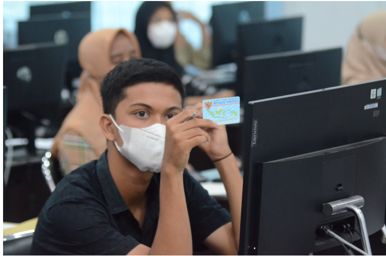
Pelaksanaan UTBK SBMPTN 2022 di Universitas Malikussaleh.