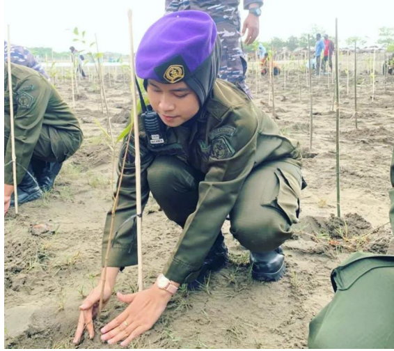
Menwa Unimal Ikut Sukseskan Penanaman 2000 Pohon Mangrove di Pantai Rancong