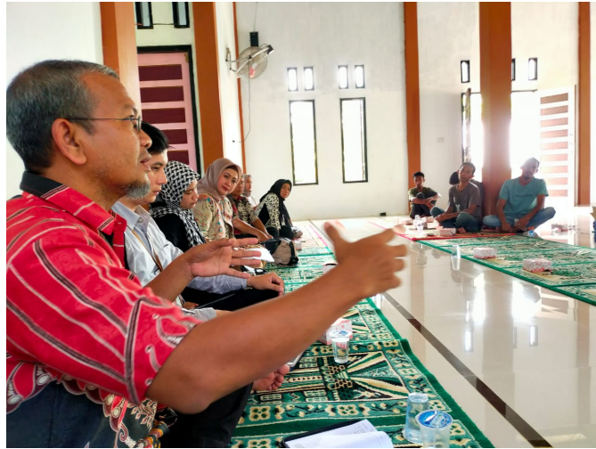
Kolaborasi dengan BNN dan BI, Unimal Lakukan Penyuluhan Kepada Para Petani