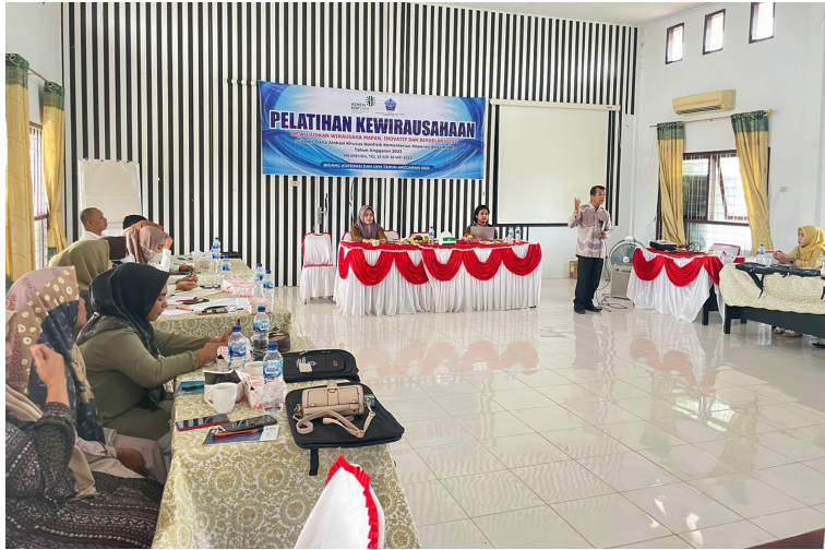
Dua dosen Fakultas Ekonomi dan Bisnis Universitas Malikussaleh menjadi pemateri pelatihan 30 calon wirausahawan di Sigli, Kabupaten Pidie, 23-26 Mei 2023.