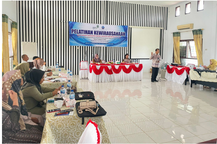
Dua dosen Fakultas Ekonomi dan Bisnis Universitas Malikussaleh menjadi pemateri pelatihan 30 calon wirausahawan di Sigli, Kabupaten Pidie, 23-26 Mei 2023.