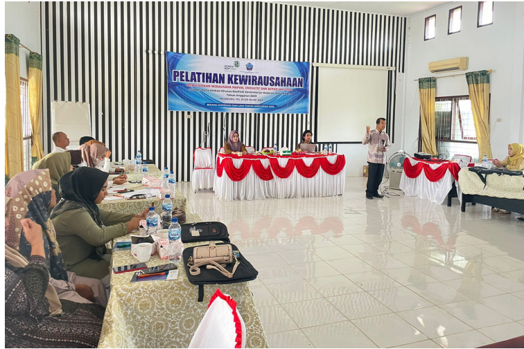
Dua dosen Fakultas Ekonomi dan Bisnis Universitas Malikussaleh menjadi pemateri pelatihan 30 calon wirausahawan di Sigli, Kabupaten Pidie, 23-26 Mei 2023.