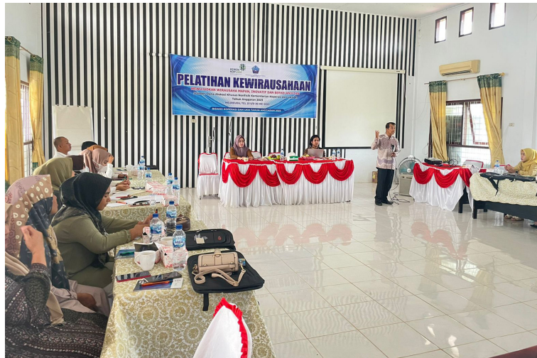
Dua dosen Fakultas Ekonomi dan Bisnis Universitas Malikussaleh menjadi pemateri pelatihan 30 calon wirausahawan di Sigli, Kabupaten Pidie, 23-26 Mei 2023.