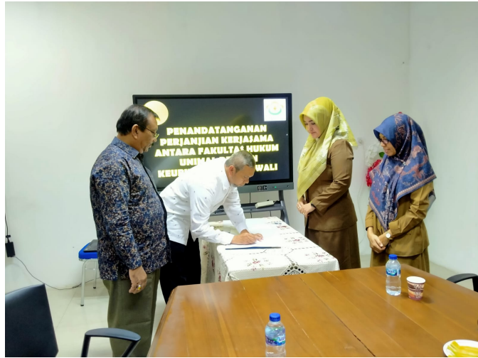
Fakultas Hukum Unimal Kerja Sama Dengan Sekretariat Lembaga Wali Nanggroe