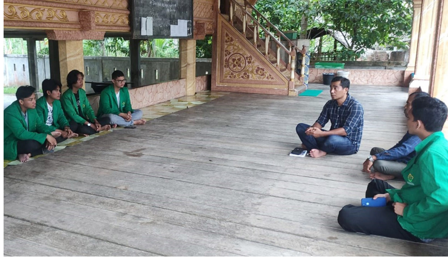
Mahasiswa KKN Kelompok 09 berdialog dengan dosen pembimbing dan Keuchik Binjee, Kecamatan Nisam, Aceh Utara, Sabtu (10/6/2023).