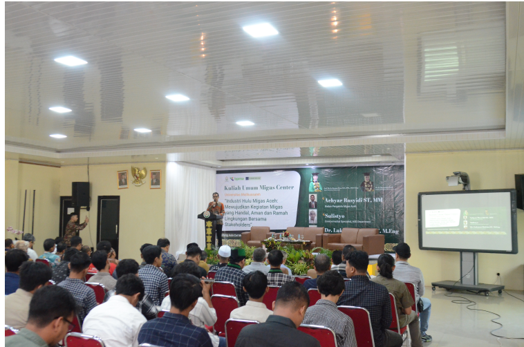
Migas Center Unimal Adakan Kuliah Umum Tentang Industri Hulu Migas Aceh.