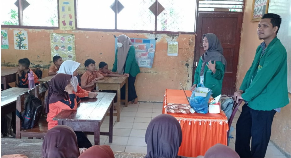
Mahasiswa KKN PPM Kelompok 09 di Gampong Binjee mendukung murid SD Negeri 7 Nisam, Aceh Utara, tentang perilaku hidup bersih dan sehat, belum lama ini.