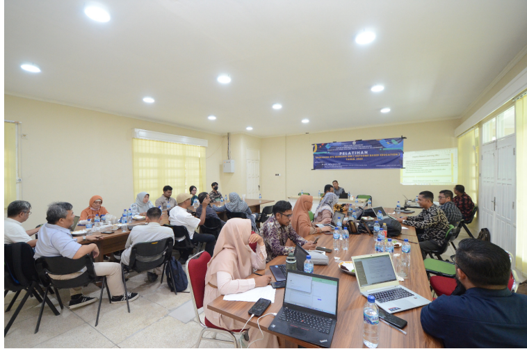
Ilmu Komunikasi Unimal Adakan pelatihan Upgrading RPS Berbasis OBE.