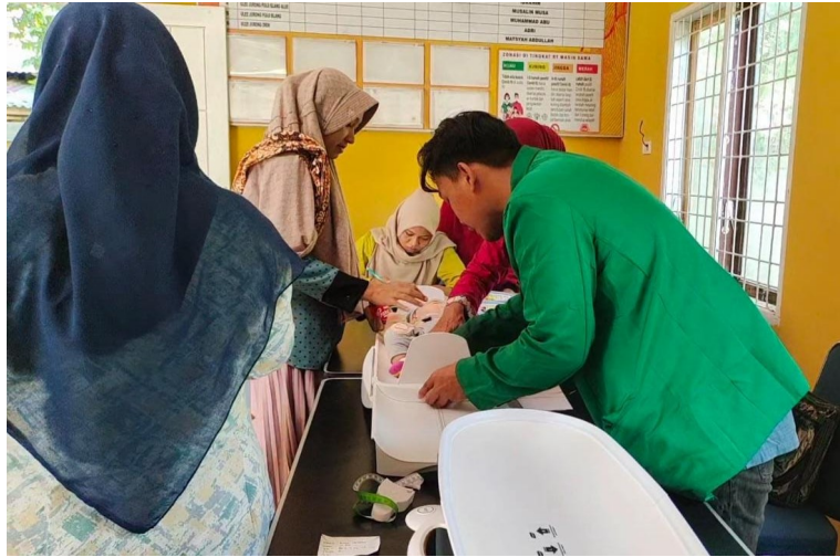
Mahasiswa KKN Kelompok 09 ikut mendukung kegiatan Posyandu di Gampong Binjee Kecamatan Nisam, Aceh Utara.