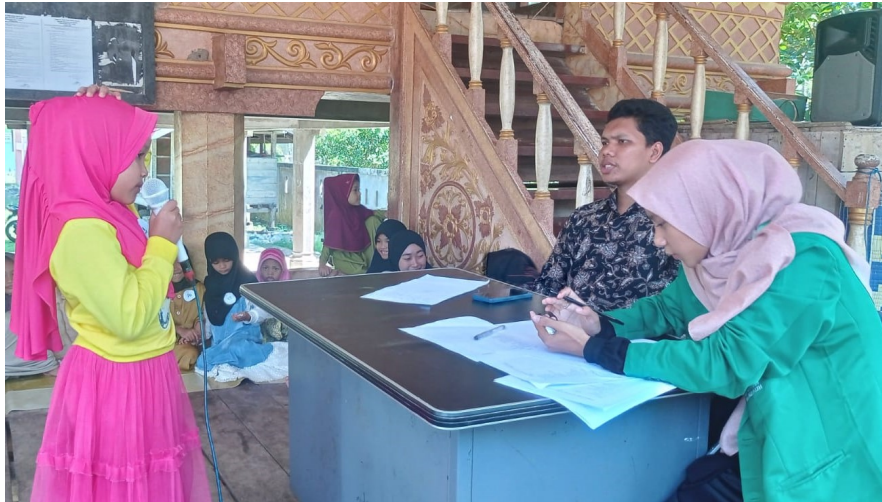
Mahasiswa Kelompok 09 menggelar aneka lomba bagi anak-anak sebagai penutup program kerja di Desa BINjee Kecamatan Nisam, Aceh Utara, akhir Juni 2023 lalu.