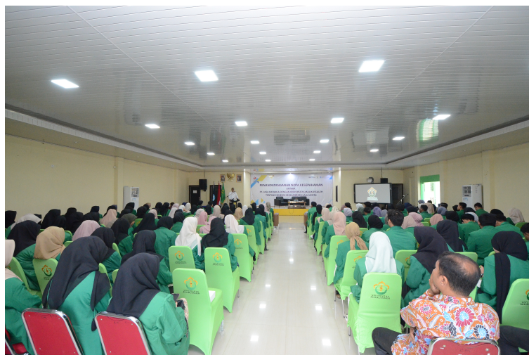
Kuliah Umum di Unimal.