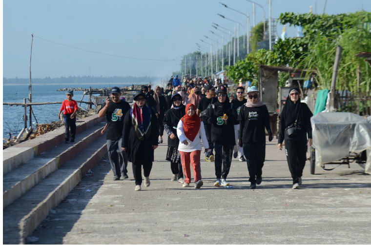
Meriahkan Dies Natalis Unimal Ke-54, Ratusan Peserta Ikuti Jalan Sehat.