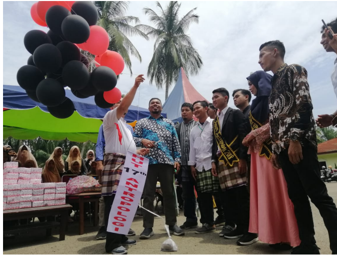
Pembantu Rektor Bidang Kerjasama Unimal (batik corak biru) bersiap melepaskan balon ke udara dalam penutupan Pekan Kuliner Antropologi 2019, Lhokseumawe (5/9/2019).