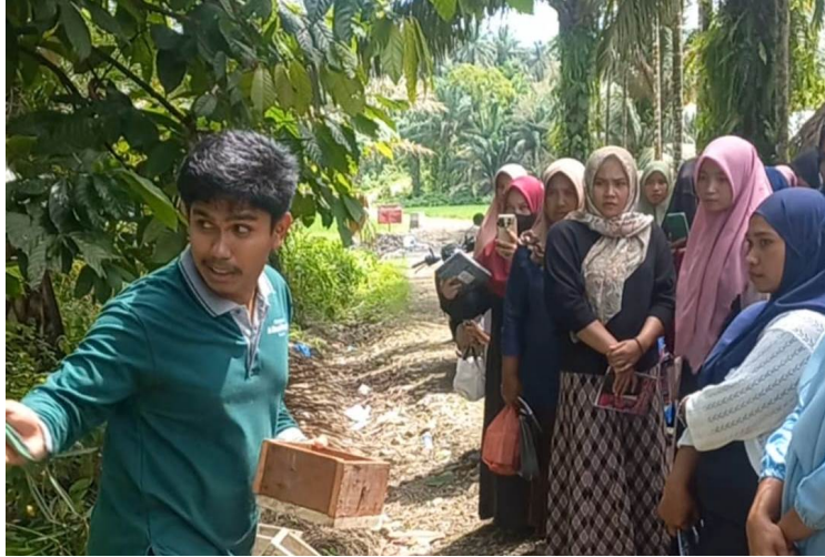
Mahasiswa Teknik Mesin Unimal Edukasi Budidaya Madu di Geurudong Pase