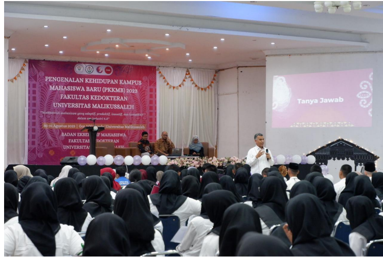
Rektor Universitas Malikussaleh memberikan materi pada kegiatan PKKMB Fakultas Kedokteran di Gor Acc Cunda Lhokseumawe, Rabu (30/8/2023).