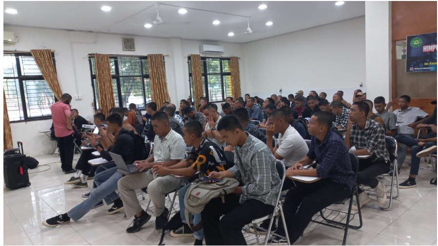
Himatesin Unimal Adakan Bimtek Pengisian KRS Untuk Mahasiswa Baru