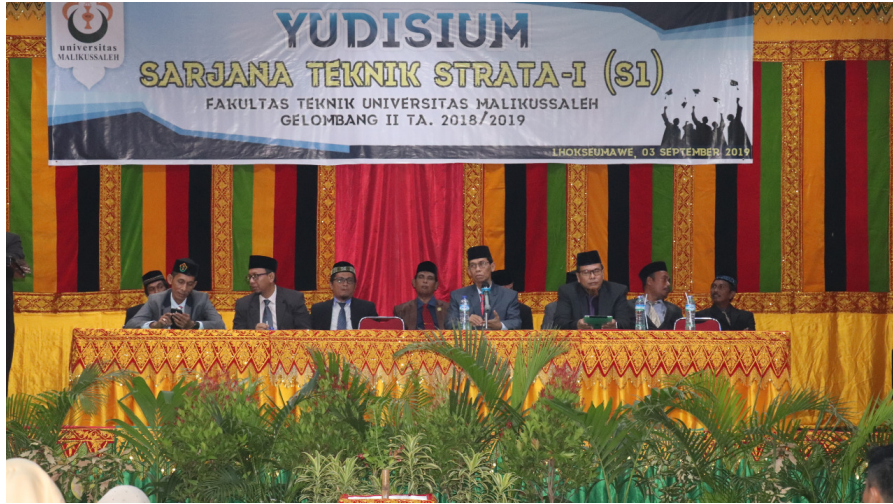
Dekan beserta pimpinan di lingkungan Fakultas Teknik Unmal dalam kegiatan yudisium Periode II tahun 2019, Selasa (3/9/2019)