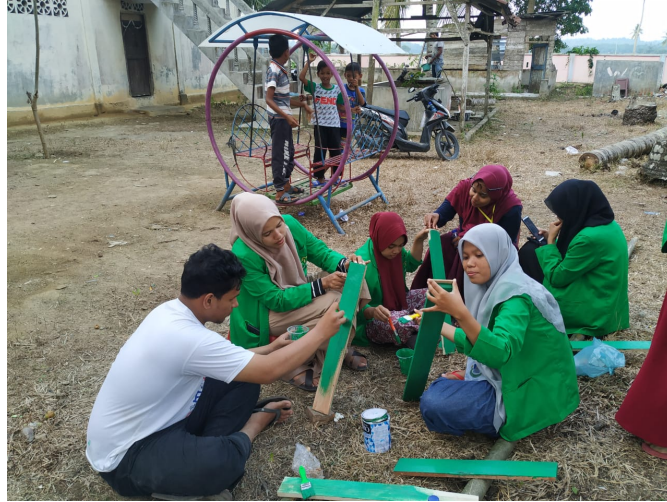
Mahasiswa KKN Universitas Malikussaleh Kelompok 85 sedang menegrikan pembuatan nama lorong untuk gampong Krueng Seupeng, Jum'at (6/9/2019). FO IST