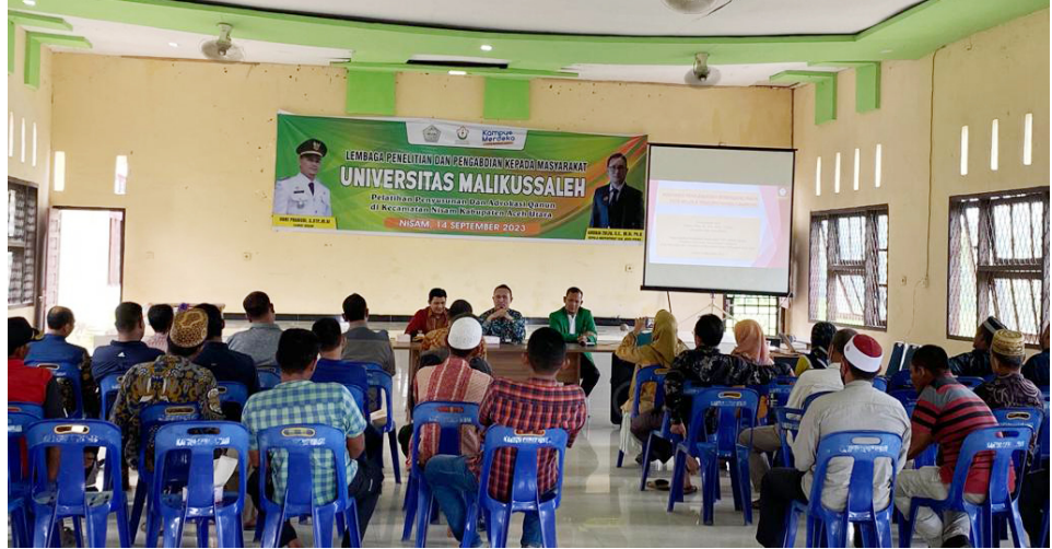
Dosen Unimal Gandeng Kepala Inspektorat Aceh Utara Adakan Pelatihan Tata Kelola Pemerintahan Gampong di Nisam