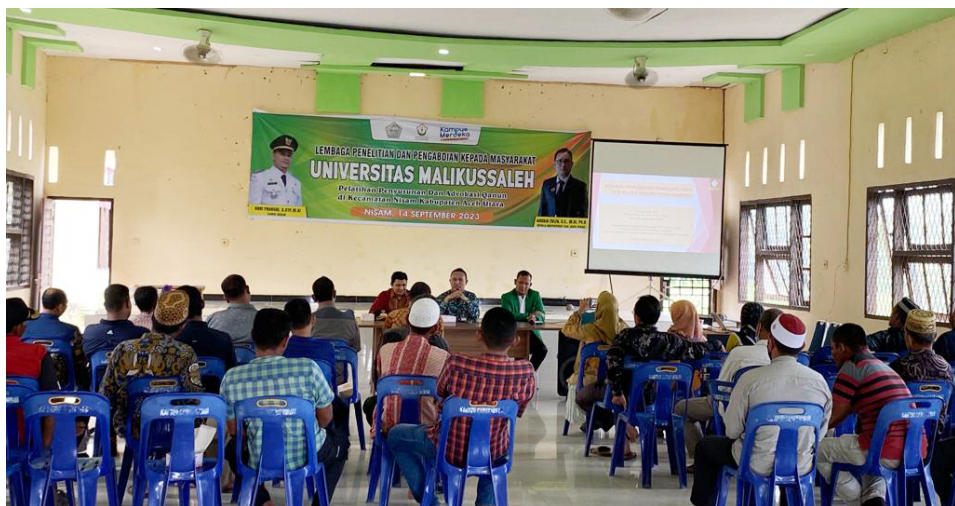
Dosen Unimal Gandeng Kepala Inspektorat Aceh Utara Adakan Pelatihan Tata Kelola Pemerintahan Gampong di Nisam