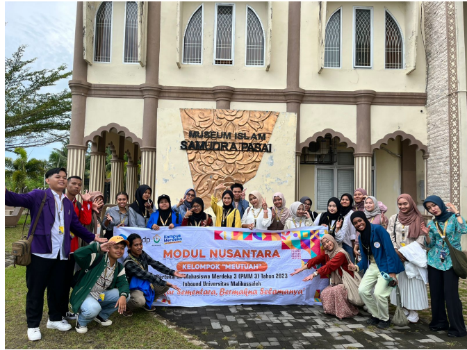
Kelompok Meutuah Pertukaran Mahasiswa Merdeka (PMM) di Universitas Malikussaleh kunjungi Museum Samudera Pasai di Gampong Beuringen, Kecamatan Sabtu (23/9/2023).