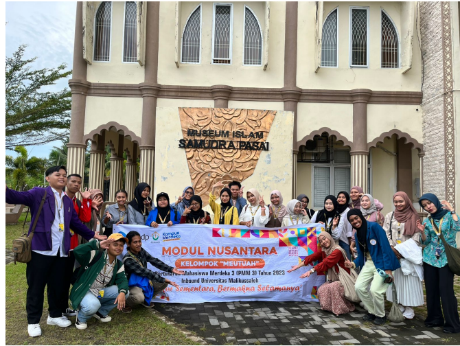
Kelompok Meutuah Pertukaran Mahasiswa Merdeka (PMM) di Universitas Malikussaleh kunjungi Museum Samudera Pasai di Gampong Beuringen, Kecamatan Sabtu (23/9/2023).