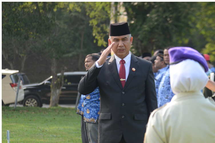
Upacara Hari Kesaktian Pancasila, Rektor Unimal: Semangat Kesatuan itu Ada di Gotong Royong.