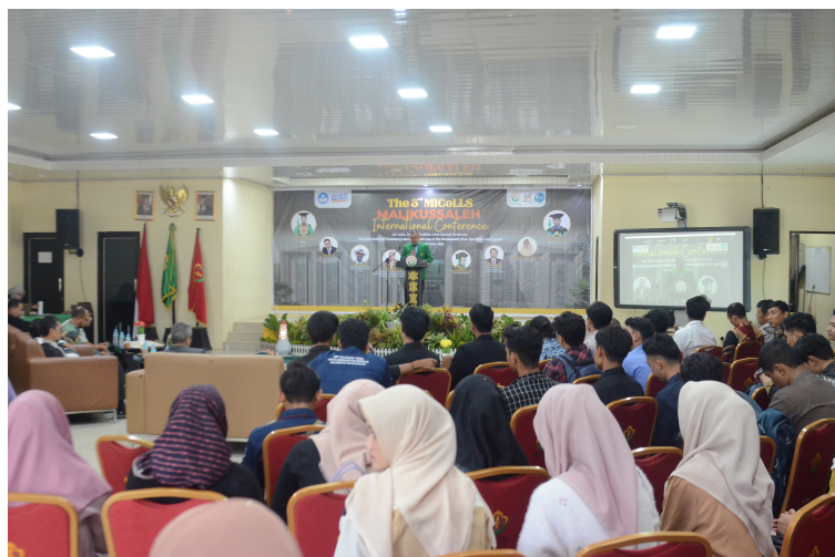
Fakultas Hukum Unimal Gelar MICoLLS 2023 tentang Kontribusi Hukum Adat dan Islam dalam Pembangunan.