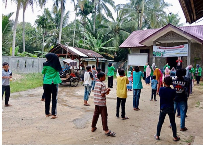
Mahasiswa KKN Kelompok 97 di Desa Pulo Iboh Kecamatan Kuta Makmur, Aceh Utara, mengajarkan anak-anak setempat senam pinguin, Minggu (8/9/2019).