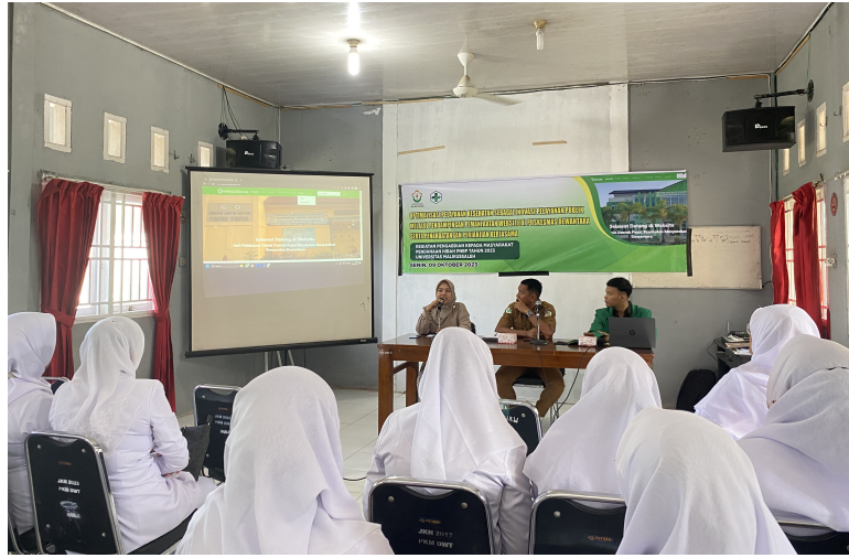
Dosen Unimal launching website optimalisasi pelayanan kesehatan di Puskesmas Dewantara, Aceh Utara, Senin (9/10/2023).