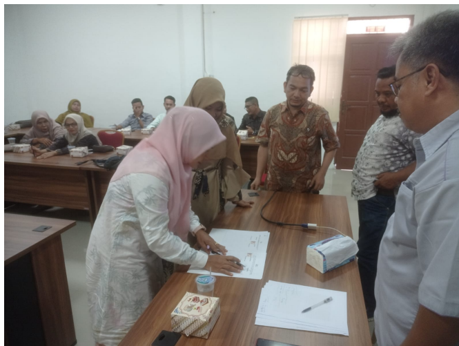
Dosen Sosiologi Unimal Beri Pendampingan MGMP Pada Guru SMA/MA di Aceh Utara