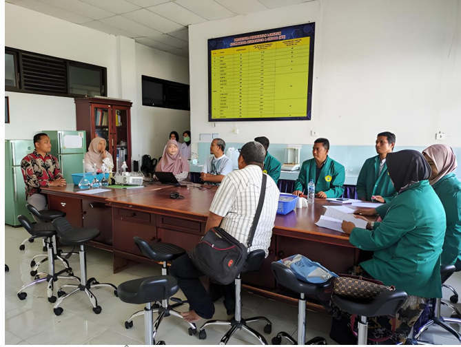
Laboratorium KJT Unimal terima kunjungan mahasiswa Umuslim Bireuen dalam rangka melaksanakan praktikum di Kampus Reuleut, Muara Batu, Aceh Utara