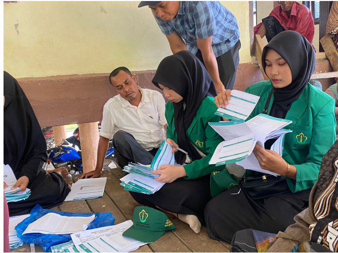
Mahasiswa KKN-PPM 109 Bantu Aktivasi Kartu Tani Digital di Nisam