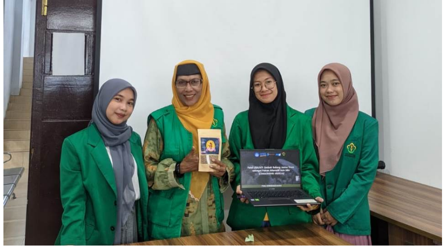
Tim PKM-K Agroekoteknologi Unimal Ikuti PKP2 Kemdikbudristek 2023