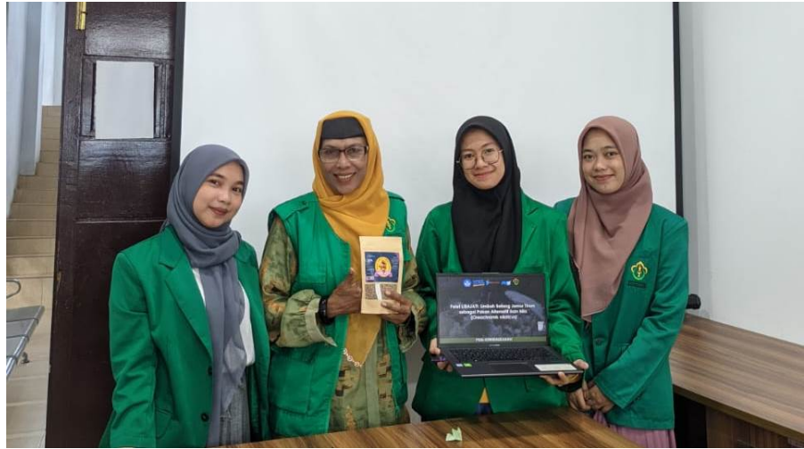
Tim PKM-K Agroekoteknologi Unimal Ikuti PKP2 Kemdikbudristek 2023