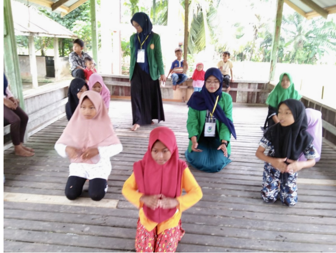
Mahasiswa KKN Kelompok 33 di Desa Meunasah Masjid Kecamatan Meurah Mulia, Aceh Utara, mengajarkan tari tradisional bagi anak-anak setempat untuk menumbuhkan rasa nasionalisme.