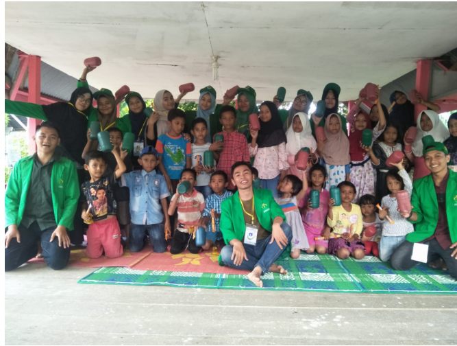
Mahasiswa KKN Universitas Malikussaleh kelompok 63 berfoto bersama anak-anak di gampong Ulee Ceubrek Kecamatan Meurah Mulia seais sosialisasi pentingnya menabung, Sabtu (8/9).