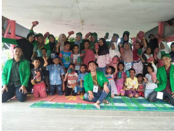
Mahasiswa KKN Universitas Malikussaleh kelompok 63 berfoto bersama anak-anak di gampong Ulee Ceubrek Kecamatan Meurah Mulia se usai sosialisasi pentingnya menabung, Sabtu (8/9).