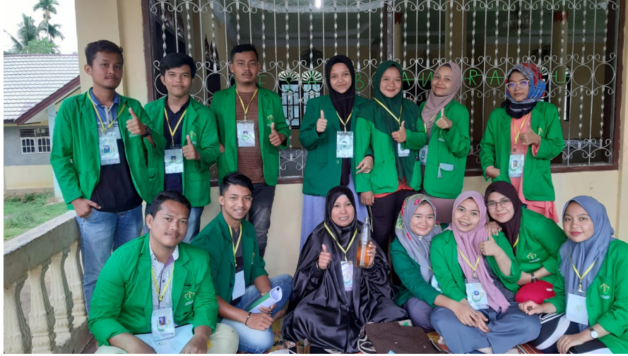
Mahasiswa KKN kelompok 02 Unimal olah Teh Dari Kulit Rambutan.