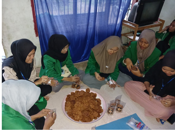
Mahasiswa KKN K75 Bantu Pemasaran Produk Lokal di Gampong Gunci