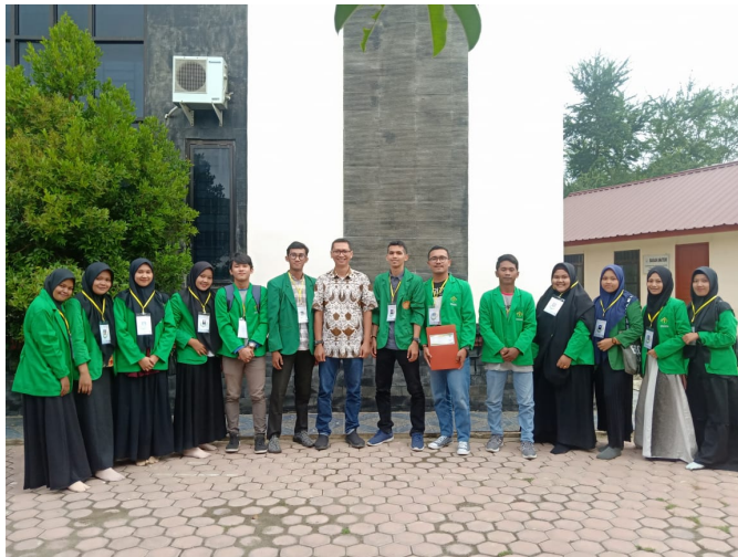
Mahasiswa KKN Unimal Kelompok 92.