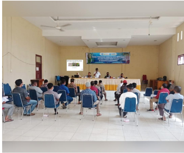
Dosen Unimal Adakan FGD dengan Pelaku Industri Kecil Menengah di Aceh Utara