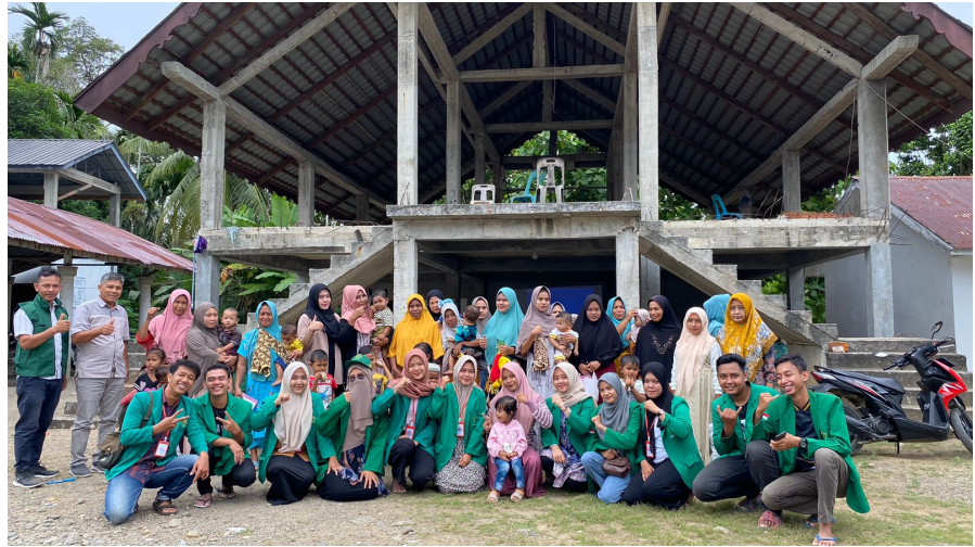
Mahasiswa KKN 72 Beri Penyuluhan Cegah Stunting dan Asupan Makanan Bergizi.