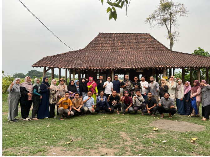
Peserta kursus Bahasa Inggris dari Universitas Malikussaleh yang mengikuti pelatihan di Lembaga Myelin Language Center.