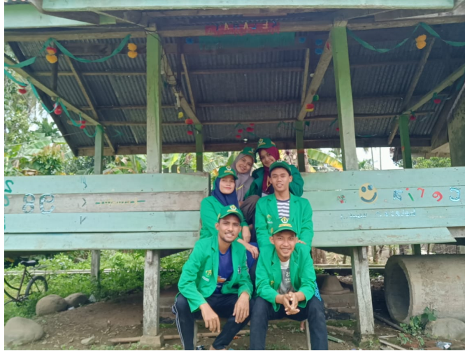
Mahasiswa KKN-PPM kelompok 98 Unimal.