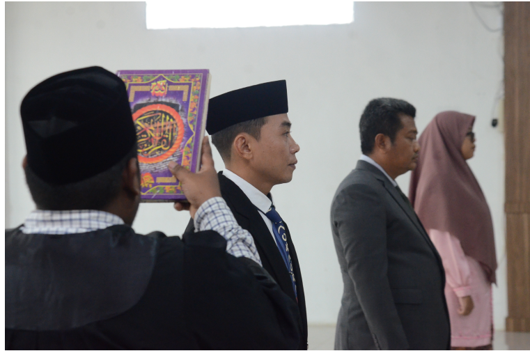
Unimal Lantik Lima Pejabat Baru, Ini Posisinya