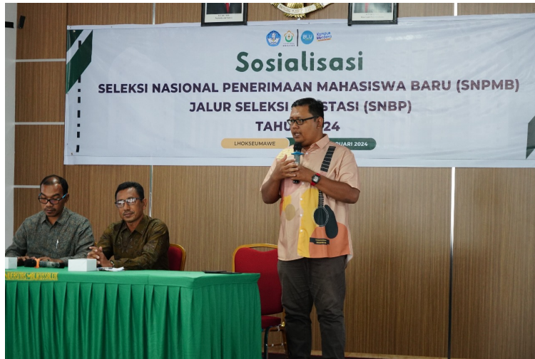
Tim sosialisasi dan promosi Unimal melakukan sosialisasi SNPMB di wilayah Lhokseumawe dan Aceh Utara, Sabtu (24/2/2024).