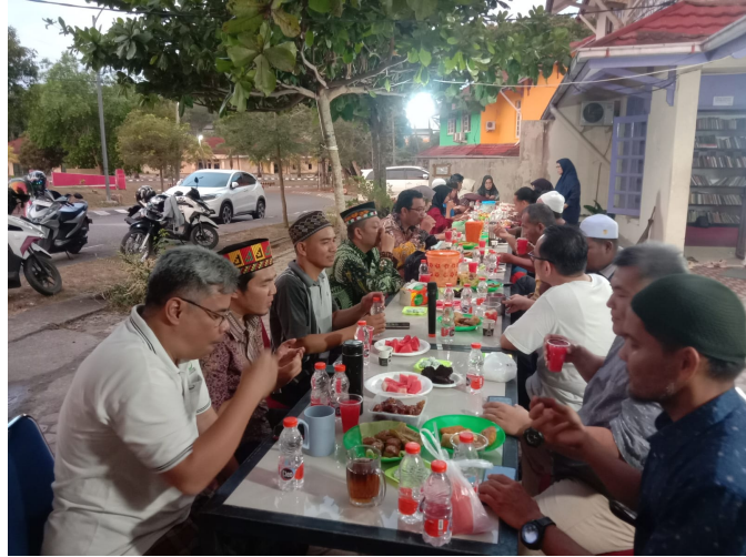
Buka puasa bersama Jurusan Antropologi dan Sosiologi, Rabu (3/4/2024).