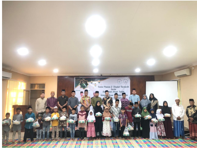
Semangat Berbagi, Fakultas Hukum Unimal Santuni Anak Yatim Piatu Desa Lingkungan