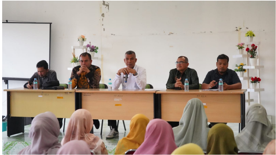
Hari Pertama Kerja Usai Lebaran, Fakultas Pertanian Unimal Gelar Acara Halalbihalal