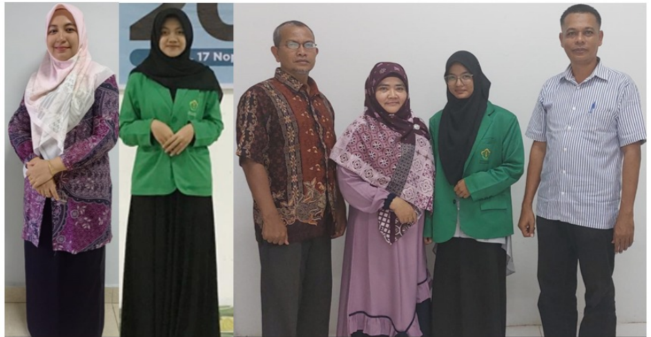
Mahasiswa Pertanian Unimal Presentasikan Makalah Pada International Collaborative Seminar